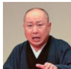
落語家 三遊亭 圓馬