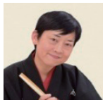
落語家 桂 右團治